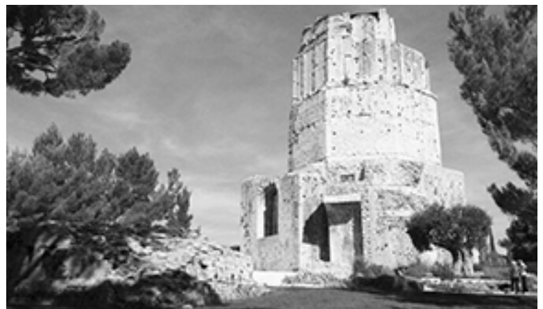
La Tour Magne au milieu de son écrin de verdure